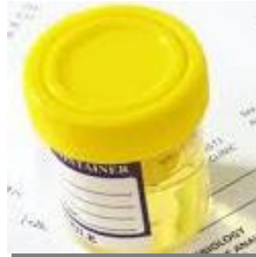
Imagen 1: Imágenes del kit diagnóstico