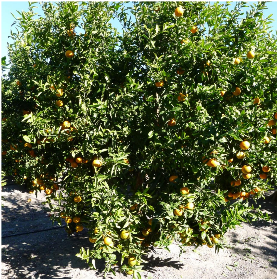
Porte del arbol de la variedad