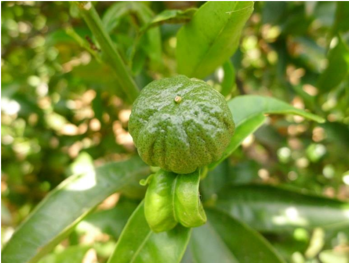
Frutos recién cuajados