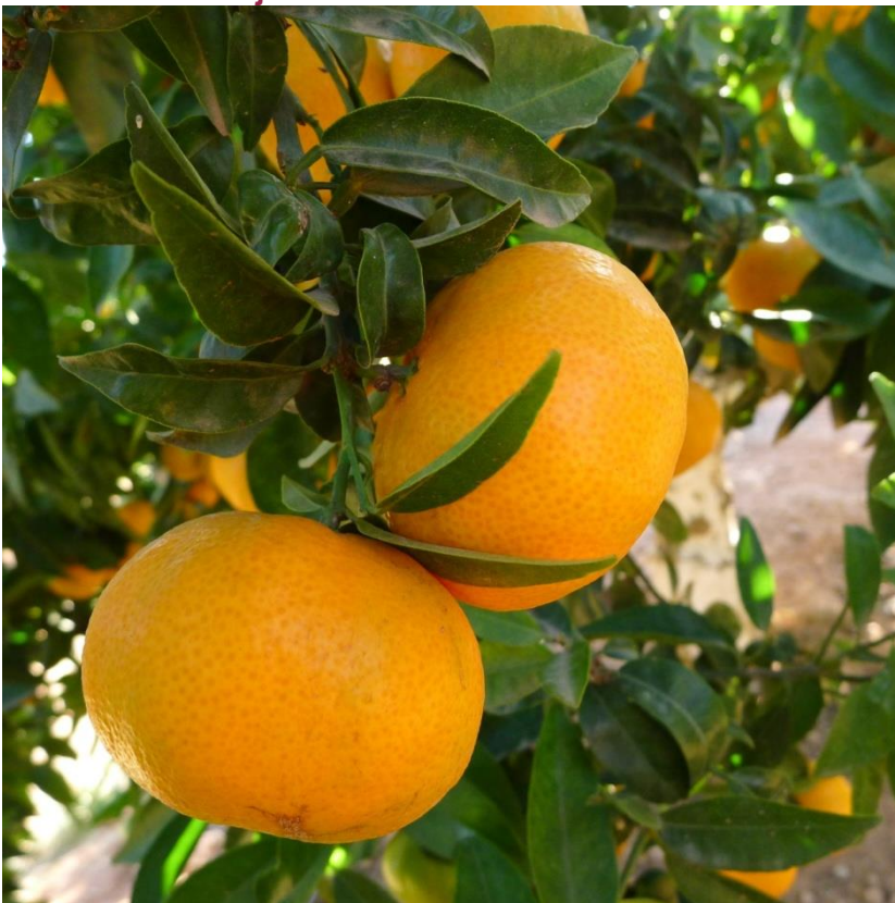
Frutos en árbol