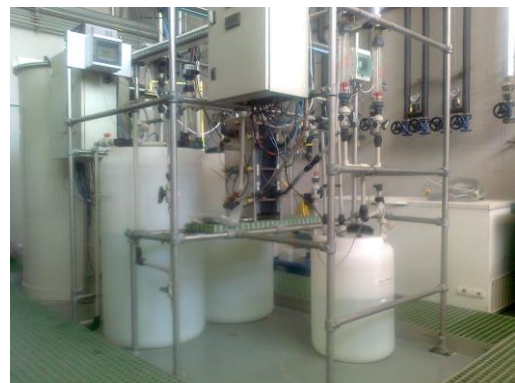
Figura 2. Planta piloto de demostración.