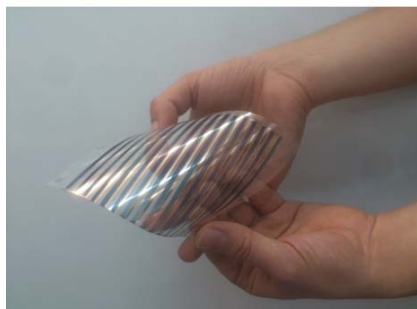
Imagen 2: Flexibilidad del dispositivo termoeléctrico